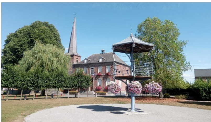
Le Grand Debut BAL DU KIOSQUE // 28 juin