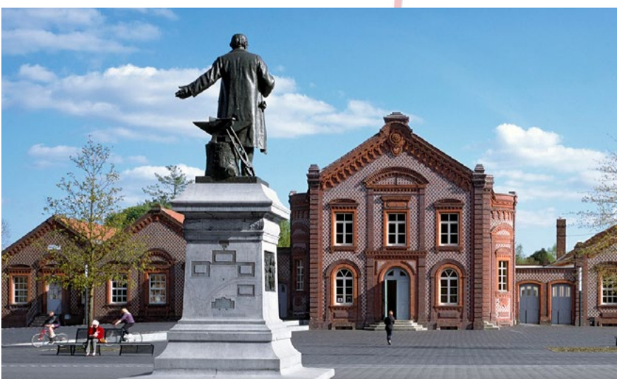
2h32 - Morbus Théâtre // 14 juin