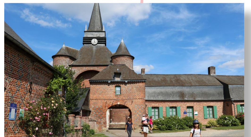
Échappée à Parfondeval // 4 mai