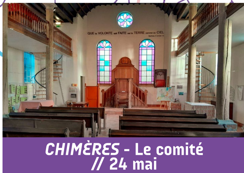
CHIMÈRES - Le comité // 24 mai