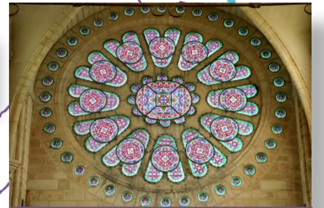
Not / - cie Li(lu0) 5 mai