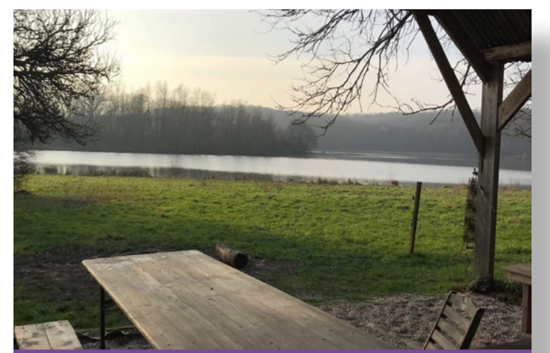
RESTER RIVAGE, HEJ HEJ TAK // 1 juin