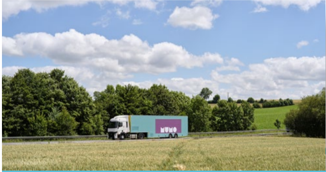
MuMo X Pompidou 2 au 8 mai