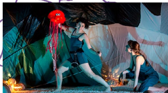
BÉBÉCHAPPÉE 3 au 5 juin